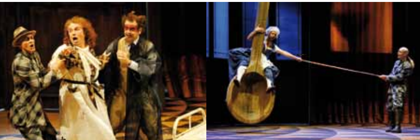
Die Benefiz-Operngala 2010 im Stadttheater Bern mit «L' amour des trois oranges» von Sergej Prokofjew

Mit dem Gewinn aus den Benefiz-Galas im Stadttheater Bern hilft Caritas Bern Menschen in Not.