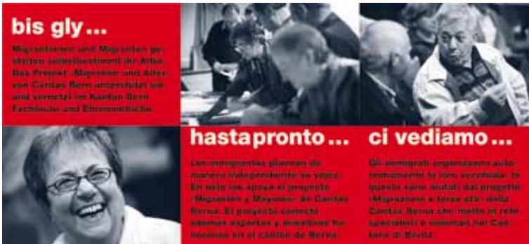
Im Auftrag des Kantons Bern konnten die Aktivitäten von Migration und Alter in Lyss und Ins-Täuffelen fortgesetzt werden.

Freiwillige begleiteten Kinder aus armutsbetroffenen Familien im Patenschaftsprojekt «mit mir – avec moi» in ihrer Freizeit. Insgesamt laufen in Bern und Biel rund 70 Patenschaften.