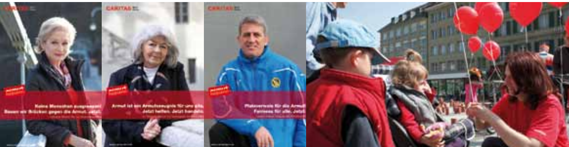
Berner Prominenz wie die Schauspielerin Heidi Maria Glössner, Alt-National- und Regierungsrätin Leni Robert sowie YB-Trainer Vladimir Petkovic unterstützen die Kampagne «Armut halbieren» der Caritas.

Die Medien berichteten im vergangenen Jahr 79 Mal über die Caritas Bern und ihre Dienstleistungen: Fernsehen (5 Auftritte), Radio (3) sowie Zeitungen und Zeitschriften (71). Dazu kam die Herausgabe haus-eigener Drucksachen, zum Beispiel von zwei Ausgaben des Magazins «Nachbarn».