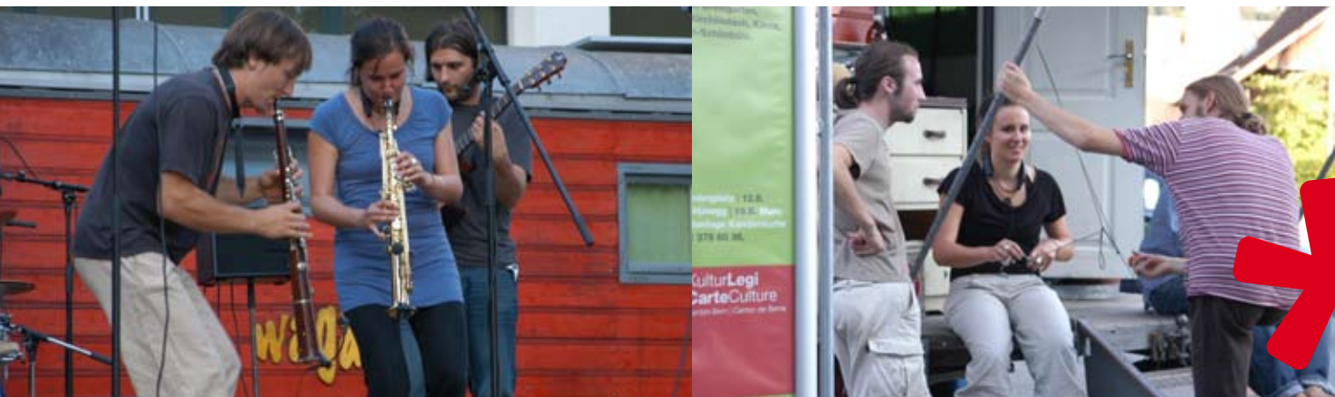
«Wagabundis» in Aktion. Die junge Berner Mundartband tourte im Sommer 2009 durch die Berner Regionsgemeinden, die neu bei der KulturLegi mitmachen.

Die Fachstelle Freiwilligenarbeit koordinierte die Freiwilligenarbeit und begleitete die mehr als 100 Freiwilligen, die Arbeit im Umfang von rund 7500 Stunden in Projekten und Administration geleistet haben.