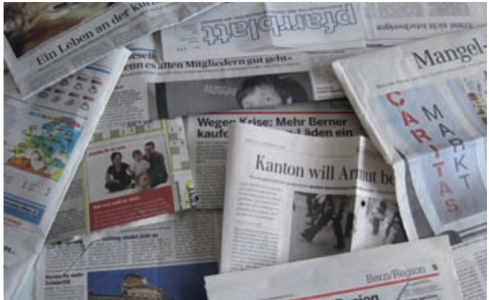
40 Prozent mehr Medienpräsenz als im Vorjahr gab es 2009 für die Caritas Bern: Eine Folge der Wirtschaftskrise, der gestiegenen Zahl der Armutsbetroffenen und der verstärkten Öffentlichkeitsarbeit.

Die steigende Medienpräsenz von Caritas Bern zeigt sich in total 78 Medienkontakten, eine Zunahme um die 40 Prozent: Fernsehen (6 Auftritte), Radio (9) und Presse (63) berichteten über die Caritas-Märkte, die KulturLegi und «comprendi?». Im Pfarrblatt erschienen 7 Beiträge. Diese Zunahme freut uns, weckt aber Besorgnis, weil sie ein Indikator für die Zunahme von Armutsbetroffenen ist.