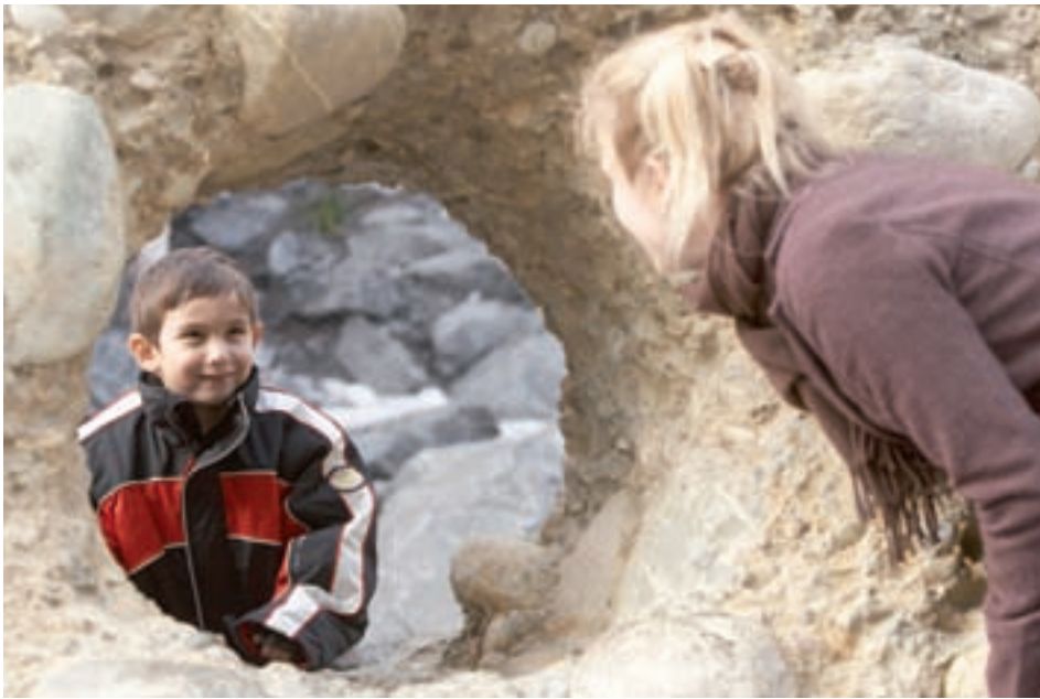
Freiwillige schenken Kindern aus armutsbetroffenen Familien Zeit. 2009 übernahmen 60 Frauen und Männer solche «mit mir»-Patenschaften, 11 mehr als im Vorjahr.

Im vergangenen Jahr reagierte Caritas Bern in den drei Abteilungen «Migration», «Soziale Aufgaben und Animation» sowie «Kommunikation und Dienstleistungen» mit Bewährtem und Neuem auf die Wirtschaftskrise.