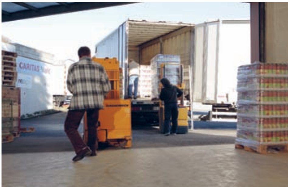
Die Warenzentrale des Caritas-Markts beliefert 19 Caritas-Märkte in der ganzen Schweiz.

Drehscheibe Caritas-Warenzentrale: Im luzernischen Rothenburg werden die Produkte, die in den Caritas-Märkten verkauft werden, akquiriert, bestellt, gelagert und in Zusammenarbeit mit einem Transportunternehmen in die ganze Schweiz verteilt.