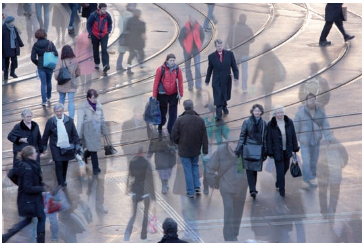
Armut ist schwer fassbar, weil sie mehrdimensional und mehrschichtig ist.

Die Armut nimmt zu. Die Arbeitslosigkeit wächst. Die Kosten für Sozialhilfe steigen. Die bernische Gesundheits- und Fürsorgedirektion hat das Problem erkannt und Ende 2008 einen Sozialbericht veröffentlicht. Nun fordert eine Motion im Grossen Rat Massnahmen zur Bekämpfung der Armut. Den Fakten und Analysen sollen Taten folgen.